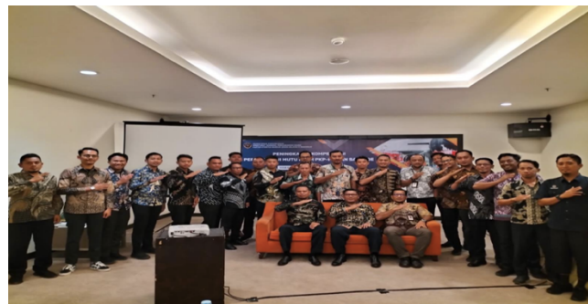
Gambar 4. Foto Bersama sekaligus penutupan pelatihan

Pelatihan pengujian kualitas foam yang melibatkan inspektur OBU Wilayah V Makassar dan personel PKP-PK dari 15 bandar udara ini memberikan sejumlah hasil signifikan yang dapat dianalisis lebih lanjut, diantaranya adalah: