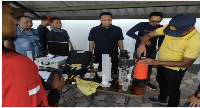
Gambar 2. Praktik langsung oleh peserta

Ini merupakan sesi inti dari pelatihan, di mana peserta dibagi ke dalam beberapa kelompok kecil untuk melakukan praktik pengujian secara langsung. Setiap kelompok dibimbing oleh instruktur untuk memastikan prosedur dilaksanakan sesuai standar. Pengujian yang dilakukan mencakup beberapa parameter kunci seperti yang dijelaskan dalam Tabel 2.