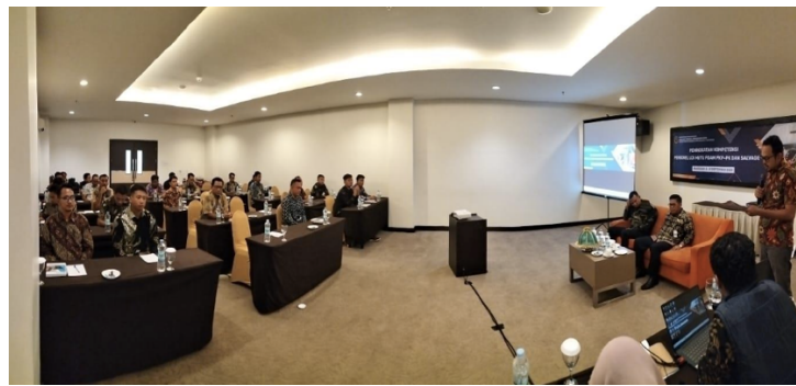
Gambar 1. Kegiatan pelatihan diawali dengan seremoni pembukaan resmi

Tahapan Kegiatan pelaksanaan pelatihan dibagi ke dalam empat tahapan utama, yaitu pertama pembukaan dan paparan teori.