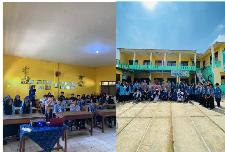
Gambar 1. Kegiatan sosialisasi kenakalan remaja

Dari 35 siswa yang mengikuti sosialisasi, 80% menyatakan bahwa mereka pernah mendengar tentang kenakalan remaja, namun hanya 50% yang mengetahui jenis-jenis perilaku yang termasuk dalam kategori tersebut. Setelah sosialisasi, 90% siswa dapat menyebutkan berbagai bentuk kenakalan remaja, seperti cyberbullying , penggunaan narkoba, dan perilaku menyimpang lainnya.