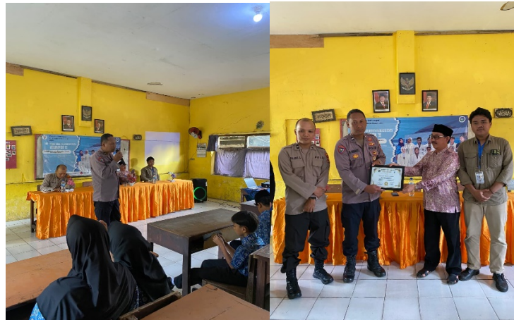
Gambar 2. Kegiatan sosialisasi kenakalan remaja