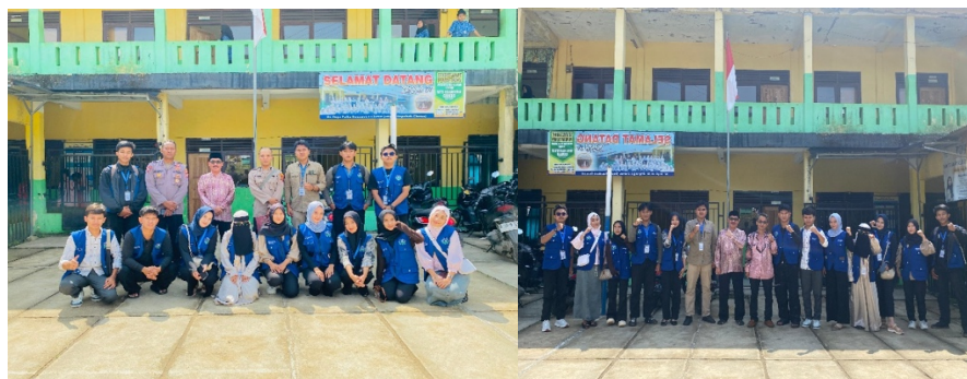
Gambar 3. Foto bersama antara Sekolah, Polsek dan Mahasiswa KKN