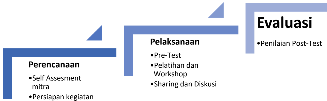
Gambar.1 Tahapan Kegiatan PKM Yang dilaksanakan

Kegiatan PKM yang dilaksanakan pada pendampingan yang diberikan kepada mitra terdiri dari beberapa tahapan, secara garis besar meliputi tahapan perencanaan, pelaksanaan, dan evaluasi kegiatan. Pada setiap tahapan yang dilaksanakan melakukan beberapa kegiatan dan secara detail seperti diperlihatkan pada gambar 1.