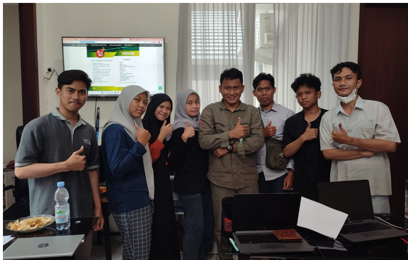
Gambar. 4 Sesi Pasca Evaluasi Kegiatan Pelatihan

Setelah dilakukannya pemberian materi yang diberikan pada pelatihan serta workshop pada peserta pelatihan maka tahapan terakhir yang dilakukan adalah melaksanakan evaluasi. Evaluasi pada kegiatan ini dilaksanakan dengan menggunakan metode wawancara karena mekanisme ujian tertulis belum bisa dilaksanakan sehingga wawancara kepada setiap peserta pelatihan dilakukan. Pada evaluasi ini hasil yang didapatkan seperti diperlihatkan pada Tabel 1 dan Gambar 5.