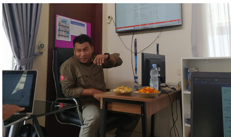
Gambar.3 Kegiatan proses pemberian Materi Pelatihan

Pada pelatihan mengenai standar jurnal nasional disampaikan bahwa terdapat update kebijakan mengenai informasi pengajuan akreditasi jurnal yang didalamnya dibahas mengenai mekanisme dan informasi detail mengenai pengajuan, batas waktu serta hal-hal lainnya terkait dengan administrasi kelengkapan akreditasi. Pada materi mekanisme pengelolaan jurnal ilmiah disampaikan mengenai materi mekanisme pengeollan yang sesuai dengan standar akreditasi disertai dengan mekanisme proses pengajuan akreditasi sampaia dengan pada proses penilaian dan hasil akhir pengumuman. Untuk dapat lebih memberikan pemahaman terhadap susbtansi isi artikel yang berkualitas aka disampaikan pula mengenai similarity dan plagiasi. Pada materi tersebut diberikan sistematika proses pengecekan similarity dan analisis indikasi plagiasi sebuah artikel ilmiah.