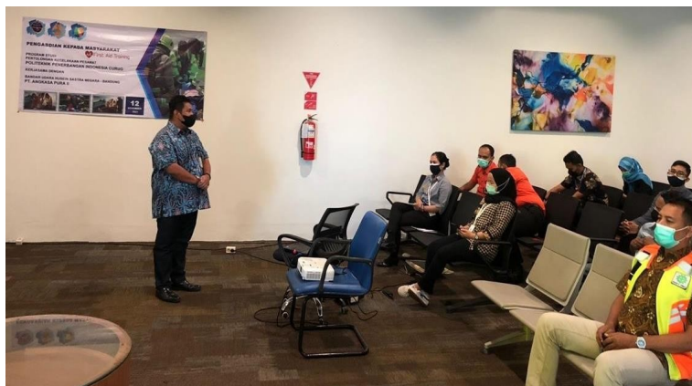
Gambar 1. Pembukaan oleh Ketua Program Studi PKP

Kegiatan PKM ini bertempat di Bandar Udara Husein Sastranegara - Bandung dibuka secara resmi oleh Direktur PPI Curug dan Ketua Program Studi PKP pada tanggal 11 November 2021 jam 09.00 WIB dengan dihadiri para pemateri dan seluruh peserta PKM.