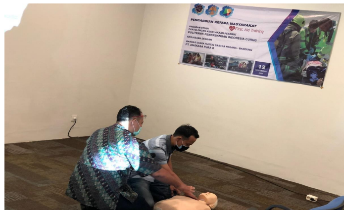
Gambar 2. Pelaksanaan Praktek Langsung dengan Pelatihan (RJP)

Resusitasi jantung dan paru adalah tindakan pertolongan pertama untuk menyelamatkan jiwa orang yang mengalami henti jantung dan henti nafas. Henti jantung dapat kita ketahui dengan cara meraba nadi di daerah leher atau lengan bawah.