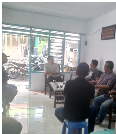
Gambar 3: Sosialisasi dan diskusi dengan warga

Pengabdian ini berhasil mendorong partisipasi aktif masyarakat setempat melalui sosialisasi dan penyuluhan, masyarakat mendapatkan pemahaman yang lebih baik mengenai pentingnya pemeliharaan drainase dan peran mereka dalam menjaga kebersihan dan kualitas drainase di Sungai Lekso. Masyarakat terlibat dalam kegiatan pembersihan saluran, perbaikan infrastruktur, dan pengelolaan sampah secara bersama-sama dengan bimbingan dan supervisi dari tim pengabdian, masyarakat juga mendapatkan pelatihan dan pendidikan mengenai teknik pemeliharaan drainase yang benar. Melalui penyuluhan, pendidikan, dan partisipasi aktif dalam kegiatan pemeliharaan, masyarakat berhasil mengubah perilaku terkait pengelolaan sampah dan kebersihan lingkungan. Masyarakat menjadi lebih peduli terhadap lingkungan sekitar, menjaga kebersihan saluran drainase, dan mengurangi penumpukan sampah di sekitar Sungai Lekso. Perubahan perilaku ini penting untuk menjaga kualitas dan fungsionalitas sistem drainase dalam jangka panjang sehingga diharapkan terjadi peningkatan kualitas dan fungsionalitas sistem drainase di Sungai Lekso. Risiko banjir dapat dikurangi, sanitasi lingkungan dapat ditingkatkan, dan kualitas hidup masyarakat di sekitar Sungai Lekso dapat meningkat. Selain itu, pengabdian ini juga dapat menjadi model yang dapat diadopsi dan diterapkan dalam pengelolaan drainase di daerah lain.