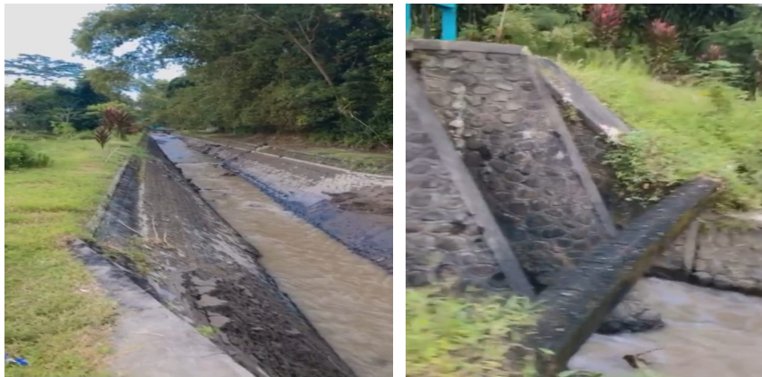
Gambar 2: Aliran Irigasi Sungai Lekso

Pengabdian ini berhasil mendorong partisipasi aktif masyarakat setempat melalui sosialisasi dan penyuluhan, masyarakat mendapatkan pemahaman yang lebih baik mengenai pentingnya pemeliharaan drainase dan peran mereka dalam menjaga kebersihan dan kualitas drainase di Sungai Lekso. Masyarakat terlibat dalam kegiatan pembersihan saluran, perbaikan infrastruktur, dan pengelolaan sampah secara bersama-sama dengan bimbingan dan supervisi dari tim pengabdian, masyarakat juga mendapatkan pelatihan dan pendidikan mengenai teknik pemeliharaan drainase yang benar. Melalui penyuluhan, pendidikan, dan partisipasi aktif dalam kegiatan pemeliharaan, masyarakat berhasil mengubah perilaku terkait pengelolaan sampah dan kebersihan lingkungan. Masyarakat menjadi lebih peduli terhadap lingkungan sekitar, menjaga kebersihan saluran drainase, dan mengurangi penumpukan sampah di sekitar Sungai Lekso. Perubahan perilaku ini penting untuk menjaga kualitas dan fungsionalitas sistem drainase dalam jangka panjang sehingga diharapkan terjadi peningkatan kualitas dan fungsionalitas sistem drainase di Sungai Lekso. Risiko banjir dapat dikurangi, sanitasi lingkungan dapat ditingkatkan, dan kualitas hidup masyarakat di sekitar Sungai Lekso dapat meningkat. Selain itu, pengabdian ini juga dapat menjadi model yang dapat diadopsi dan diterapkan dalam pengelolaan drainase di daerah lain.