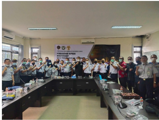
Gambar 4. Penutupan Kegiatan PKM

Merupakan sesi tanya jawab dan sesi informatif dua arah untuk memastikan pemahaman peserta dan menggali lebih dalam informasi yang ingin ditanyakan peserta yang dilanjutkan dengan sesi foto bersama.