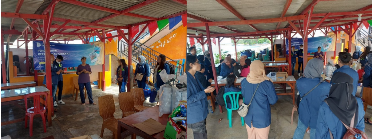
Gambar 2: Kegiatan Pembukaan Pengabdian Masyarakat Pada Masyarakat Pulau Tidung

mengelola keuangan. Financial Knowledge , Financial Behaviour dan Financial Attitude yang memiliki peran penting dalam implementasi edukasi financial management behaviour untuk semakin melek literasi keuangan dengan baik.