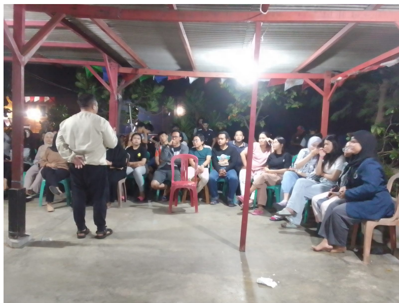
Gambar 3: Kegiatan Diskusi Financial Management Pada Masyarakat Pulau Tidung